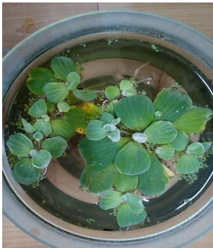
2.3–rasm. Pistia stratiotes