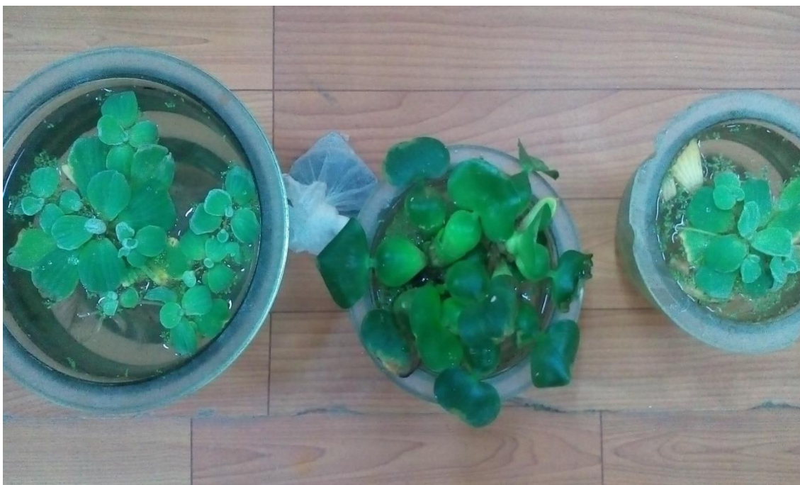
2.1–rasm. Ilmiy tadqiqot uchun Toshkentdan keltirilgan yuksak suv o‘simliklari