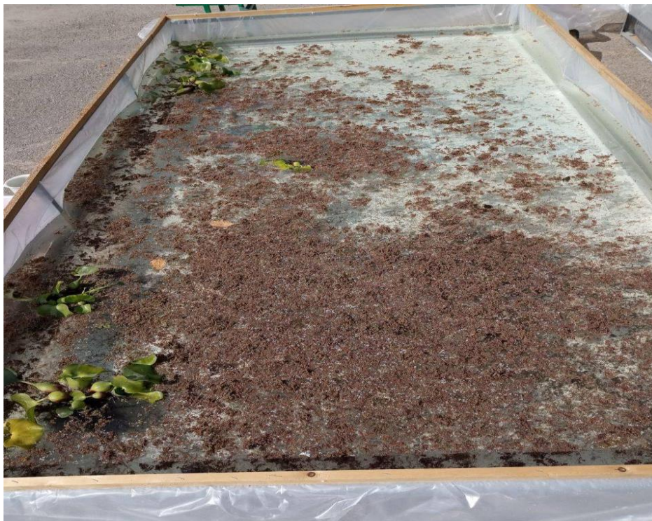
3.2–rasm. Tajribaning 3–4 kunlaridagi ko‘rinishi