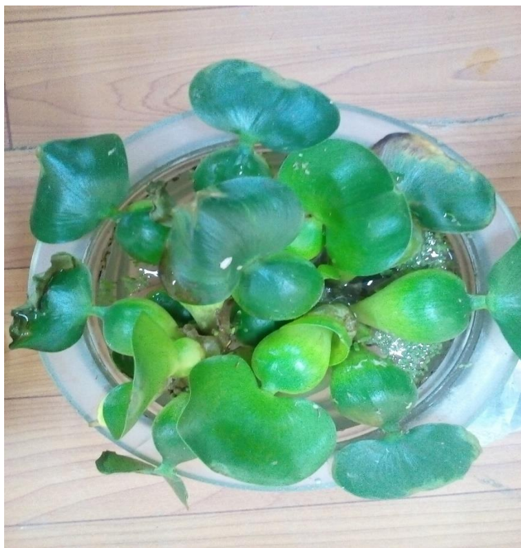
2.2–rasm. Eichhornia crassipes