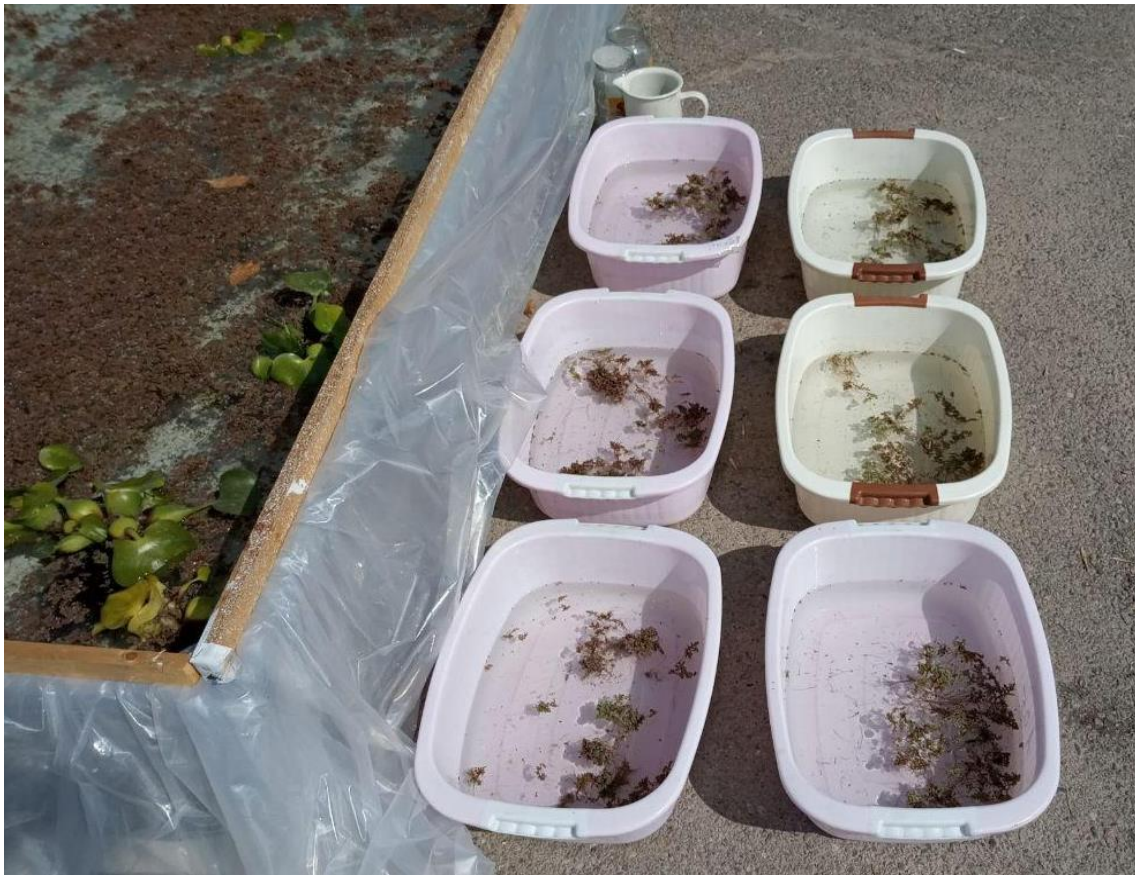
3.3–rasm. Tajribaning 1–kunidagi ko‘rinishi