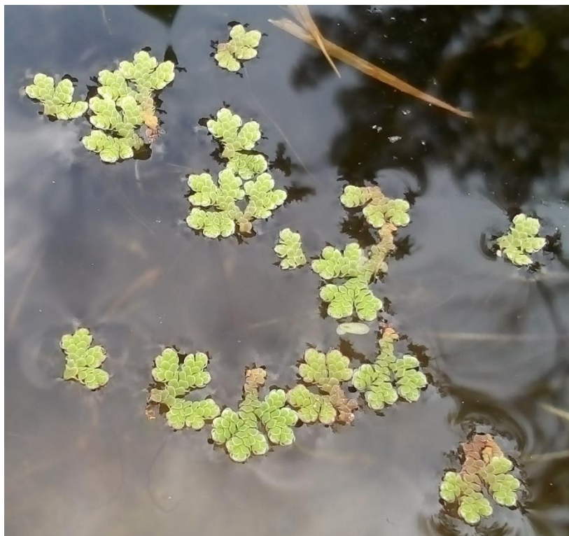
2.4–rasm. Tadqiqot obyekti sifatida olingan – Azolla caroliniana

Qulay sharoitlarda, azolla, tez o'sib, boshqa o'simliklarni soyabon qilib, akvariumning butun yuzasini tortadi, shuning uchun ortiqcha qismini vaqti–vaqti bilan akvariumdan olib tashlash kerak.