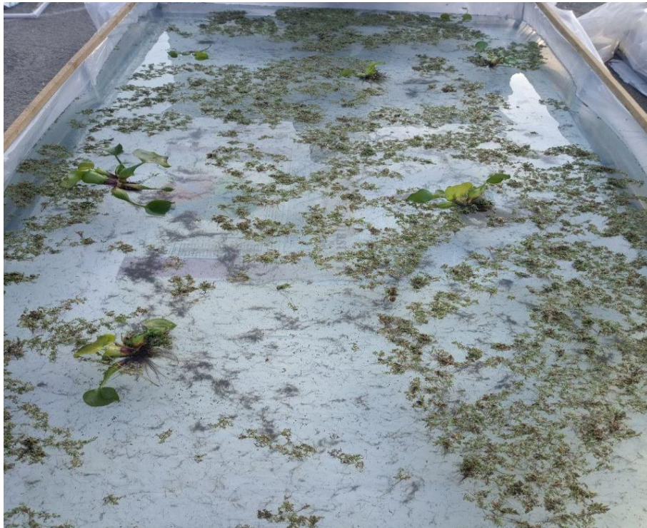
3.1–rasm. Tajribaning birinchi kunidagi ko‘rinish.